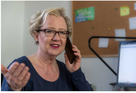
Objekt ID: 98009